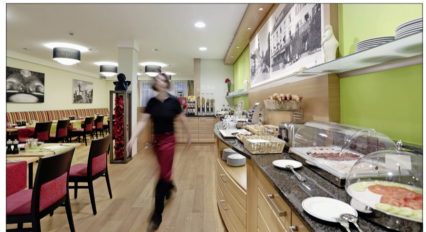
Im hellen, ebenfalls mit Schwarz-Weiss-Bildern dekorierten Frühstücksraum geniessen die Gäste das reichhaltige Frühstücksbuffet.