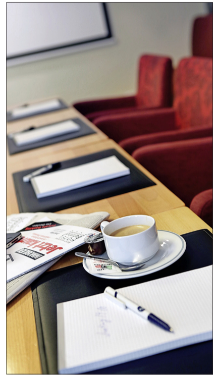
Das Stadthotel verfügt auch über einen Konferenzraum.