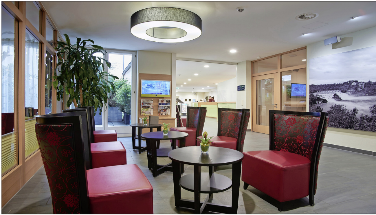
Die Farbgebung in Rot, Schwarz und Grün kommt stilistisch auch in der Lounge und der Rezeption zum Tragen. Die Wände zieren die grossformatigen Schwarz-Weiss-Bilder von der Fotografin Elge Kennewegs.

Die Zufahrt zum Hotel in der Fussgängerzone an der Bahnhofstrasse ist gewährleistet, und zwar über drei Plätze zum Ein- und Auschecken. Da in der Altstadtliegendenschaft keine Garagen und Autoabstellplätze gebaut werden konnten, stellt das Best-Western-Hotel Bahnhof seinen Gästen gegen Entgelt fünf gedeckte Parkplätze im nahe gelegenen Parkhaus Mühletal zur Verfügung. Der Schlüssel für das Parkhaus ist an der Rezeption erhältlich.