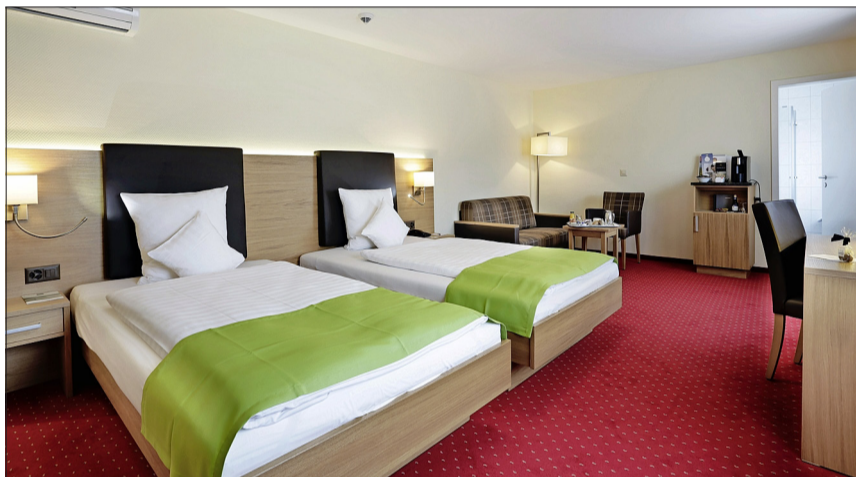
Die grosszügigen, chic eingerichteten Hotelzimmer und Suiten verfügen über den Komfort eines modernen Stadthotels.

Auch die in den Farben Rot, Grün und Schwarz gehaltenen Farben verleihen dem Dekor der Hotelräumlichkeiten eine einheitliche, angenehme Note.