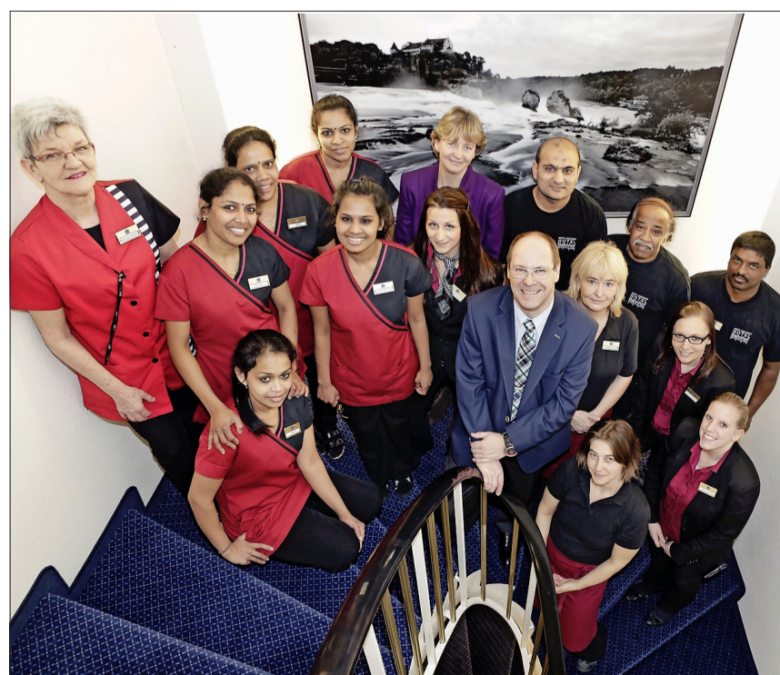
Das gesamte Team des Best Western Hotel Bahnhof wird bei der Organisations- und Unternehmensentwicklung mit einbezogen.

Wichtig ist für Hotelier Graf auch, dass die Mitarbeitenden des Betriebes laufend im kundengerechten Verhalten geschult und weitergebildet werden damit sie ihre Dienstleistungscompetenz stärken können. (Ry.)